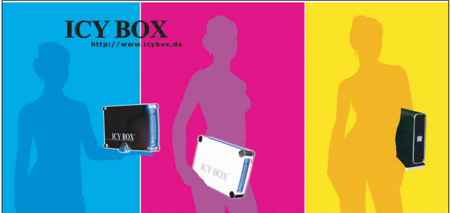
ICY BOX IB-350B-BL